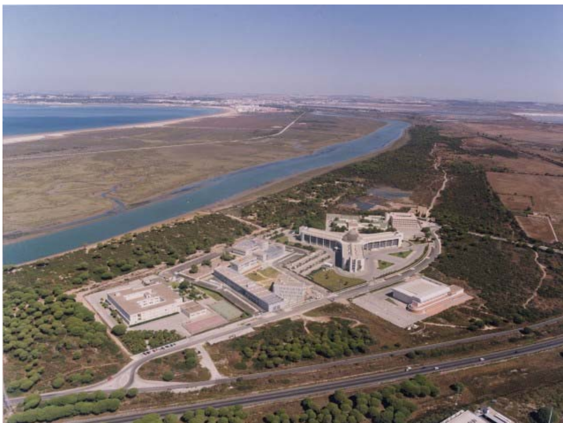
Figura 7.1.- Vista general del Campus del Polígono Río San Pedro en Puerto Real (norte hacia arriba) en la que se observan algunos de los valores ambientales del Parque Natural Bahía de Cádiz: cordones dunares, marismas y zonas endorreicas.

La Facultad de Ciencias del Mar y Ambientales, solicitante del título, se encuentra en el Campus de Puerto Real. Dicho Campus se sitúa en un entorno natural privilegiado, en pleno contacto con el Parque Natural de la Bahía de Cádiz (Fig.1) y en el centro geográfico de los municipios que constituyen la Mancomunidad de la Bahía de Cádiz, con núcleos muy importantes de población en un radio de 20 Km., incluyendo Cádiz, Jerez, San Fernando, Chiclana, el Puerto de Santa María y el municipio de Puerto Real. En su conjunto suman una población de más de 600.000 habitantes.