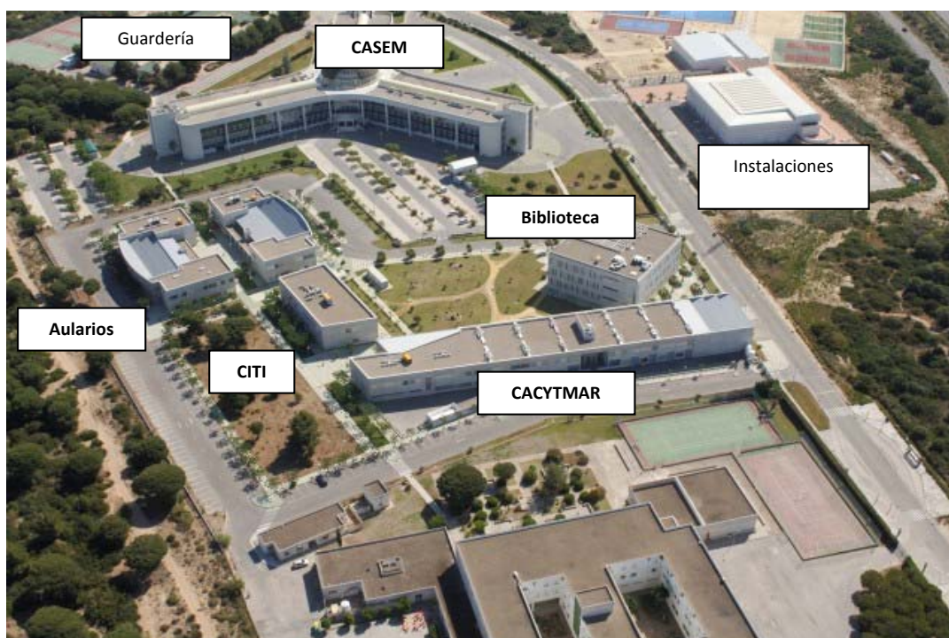
Figura 7.2.- Vista general del Campus donde se aprecia el edificio principal (CASEM), el Centro Integrado de Tecnologías de la Información (CITI), la biblioteca, los aularios y el Centro Andaluz de Ciencia y Tecnologías Marinas (CACYTMAR: centro de investigación mixto UCA-Junta de Andalucía). (Fuente: UCA).

En cuanto a los servicios de tipo social que existen en este Campus se encuentran la guardería y un amplio servicio de instalaciones deportivas: piscina cubierta, gimnasios y diversas canchas deportivas tanto cubiertas como al aire libre (Fig.7.2).