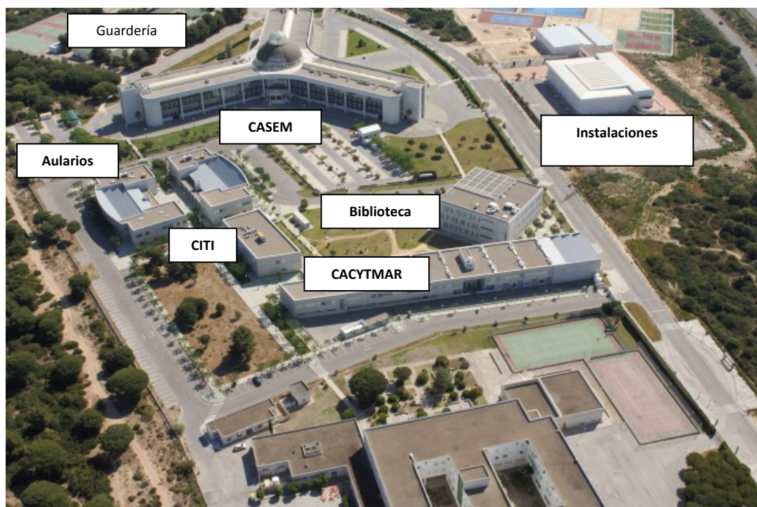
Figura 7.2.- Vista general del Campus dónde se aprecia el edificio principal (CASEM), el Centro Integrado de Tecnologías de la Información (CITI), la biblioteca, los aularios y el Centro Andaluz de Ciencia y Tecnologías Marinas (CACYTMAR: centro de investigación mixto UCA-Junta de Andalucía).

En cuanto a los servicios de tipo social que existen en este Campus se encuentran la guardería y un amplio servicio de instalaciones deportivas: piscina cubierta, gimnasios y diversas canchas deportivas tanto cubiertas como al aire libre (Fig.7.2).