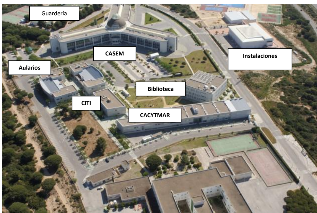
Figura 7.2.- Vista general del Campus dónde se aprecia el edificio principal (CASEM), el Centro Integrado de Tecnologías de la Información (CITI), la biblioteca, los aularios y el Centro Andaluz de Ciencia y Tecnologías Marinas (CACYTMAR: centro de investigación mixto UCA-Junta de Andalucía). (Fuente: UCA).

La Facultad de Ciencias del Mar y Ambientales es, en la Universidad de Cádiz, el centro que, actualmente, se encarga de la organización de las enseñanzas y de los procesos académicos, administrativos y de gestión conducentes a la obtención de los títulos de Másteres en Gestión Integral del Agua, en Oceanografía, en Gestión Integrada del Litoral y Acuicultura y Pesca. Para ello, nuestra Facultad cuenta con un notable conjunto de infraestructuras y recursos que se ha ido incrementando y mejorando desde su creación hasta la actualidad, en la que se dispone de una notable dotación de aulas y laboratorios de docencia que se detallan más adelante. El edificio principal es el Centro Andaluz Superior de Estudios Marinos (CASEM).