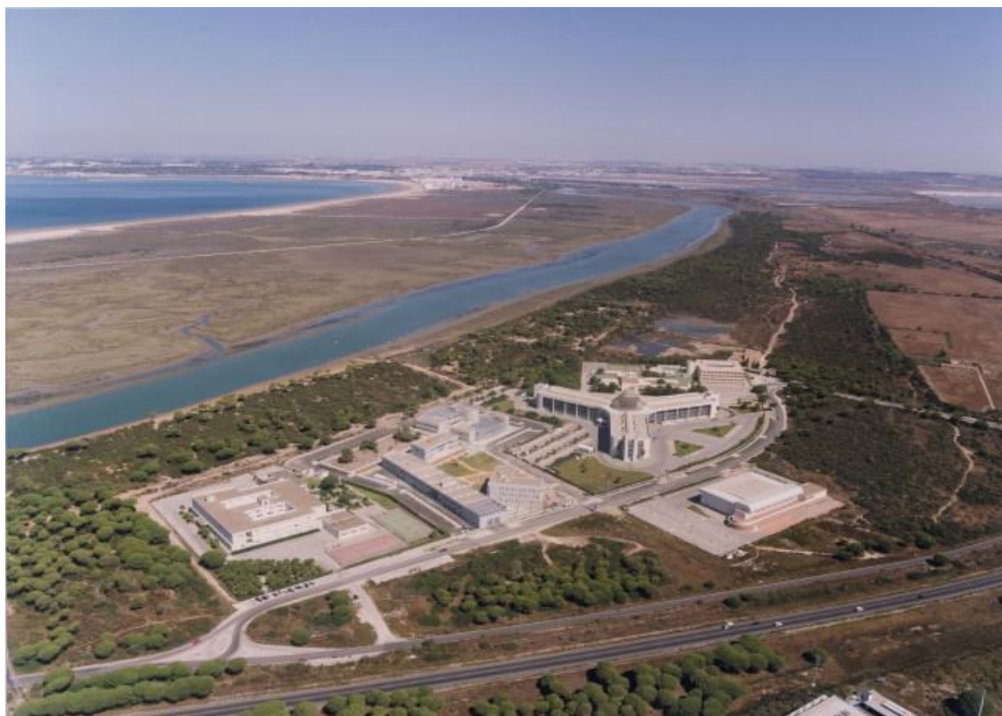
Figura 7.1.- Vista general del Campus del Polígono Río San Pedro en Puerto Real (norte hacia arriba) en la que se observan algunos de los valores ambientales del Parque Natural Bahía de Cádiz: cordones dunares, marismas y zonas endorreicas.

La Facultad de Ciencias del Mar y Ambientales, solicitante del título, se encuentra en el Campus de Puerto Real. Dicho Campus se sitúa en un entorno natural privilegiado, en pleno contacto con el Parque Natural de la Bahía de Cádiz (Fig. 7.1) y en el centro geográfico de los municipios que constituyen la Mancomunidad de la Bahía de Cádiz, con núcleos muy importantes de población en un radio de 20 Km., incluyendo Cádiz, Jerez, San Fernando, Chiclana, el Puerto de Santa María y el municipio de Puerto Real. En su conjunto suman una población de más de 600.000 habitantes.